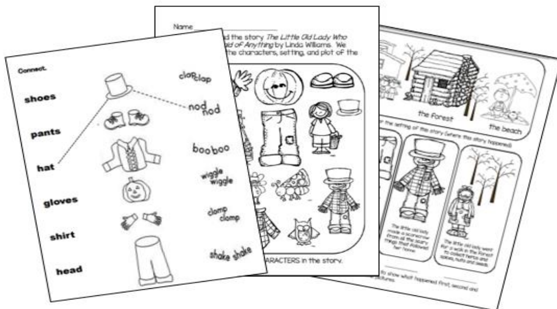
データで送られてくる教材例